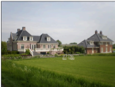
Nieuw Rustoord.

Al rondfietsend door de buitengebieden van Nederhorst den Berg lijkt het of er een inhaalslag aan de gang is. Vanwege de alom om zich heengrijpende verarming na de Franse overheersing viel de ene na de andere buitenplaats ten offer aan de door kundige handen gehanteerde slopershamer. Gek genoeg moest alles zo heel mogelijk blijven, omdat de opkoper zo'n buiten in onderdelen verkocht. Zo rond de helft van de negentiende eeuw bracht dat veel meer op. Te verwachten onderhoud aan die kapitale huizen en parken drukte de prijs zodanig dat er niets anders opzat dan ze te ontmantelen, omdat bijna niemand geld voor het onderhoud had. Bovendien groeide de behoefte aan agrarisch te exploiteren grond.