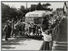
De bus gaat voor de eerste keer over de Spiegelweg

Zestig jaar Spiegelweg heeft de Hinderdam gemaakt tot een rustig, fraai landweggetje, in trek bij fietsers en wandelaars. De N523 voldoet geheel aan de eisen van het moderne verkeer.