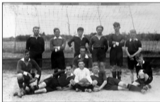
Armsen, 1931. Op de achtergrond het laatste grint in de hoek van de Propolider.