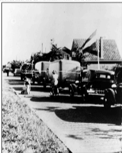
Wasserjourn's op weg naar de nieuwe Spiegelweg. Collectie HCNAB.

Dat de Spiegelweg een onmisbare schakel in het wegennet van Gooi en Vechstreek is, blijkt wel uit het feit, dat een geplande vervanging van een duiker onder die weg tot tweemaal toe uitgesteld moest worden, omdat vanwege werken aan de weg elders in de regio de Spiegelweg (N523) gebruikt moest worden als omleidingsroute. Om de verkeershinder in de omgeving niet verder te vergroten besloot de provincie Noord-Holland in 2009 tot twee keer toe de werkzaamheden uit te stellen.