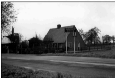
De Spiegelweg anno 2001.

Vooral door de vestiging van de Amsterdamsche Ballast Maatschappij op de grens van de gemeente tussen Vecht en Spiegelpolder werd de behoefte aan een goede verbindingsweg met Nederhorst den Berg steeds urgenter. De ABM kreeg in 1936 vergunning om zand uit de polder te zuigen tot op een diepte van 20 meter. Aanvankelijk werd het overgrote deel van het droge zand per schip vervoerd, maar uiteindelijk trok het bedrijf ook verkeer over de weg aan. In 1942 opende de Ballast de sluis tussen Spiegelpolder en Vecht, zodat ook nat zand in bakken vervoerd kon worden.