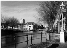
De Woerdsloos te Utrecht. Hier begint de Vecht.

Kleine resultaten werden reeds behaald. Maar als allen, die deze streek goed kennen en die dus van haar houden, hun morele en daadwerkelijke medewerking geven, ... Dan kan toch zeer veel bereikt worden. Laten dus allen, die deze onvolprezen streek liefhebben, de handen in een slaan.' Aldus de oproep van Ir. J. Loef.