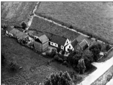
Oud Rustoord, ca. 1920.

Petersburg haar voltooiing, vlakbij de plek waar het veel bezongen oude, landelijk bekende lustoord de omgeving sierde. Dan staat er in de Horstermeer een bouwwerk, dat als zodanig te benoemen is, terwijl als klap op de vaarpijl de Prutpolder er recentelijk twee tussen zijn dijken kreeg. Die beschouw ik als een compensatie voor de buitenplaatsen 'Schulpenburg' en 'Overmeer', die uit het Overmeerse straatbeeld verdwenen. Bij de splitsing van een bocht in de Vecht met de Nesservaart (rond 1630 gegraven om die bocht af te snijden) staan ze nieuw te wezen op het terrein van het voormalige uit veel optrekjes bestaande 'buiten' Rustoord.