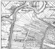
De Hinderdams en omgeving ca 1800. Historische Atlas van Noord-Holland.

geen west-oostverbindingen waren voor het rijkverkeer. De enige westverbinding (naar Nigtevecht en Amstelland) was die over de Torenweg en het Eiland naar Nigtevecht en verder, maar dan moest wel de Vecht overgestoken worden. De eerste nabije oostverbinding (richting 's-Graveland en 't Gooi) kwam pas na 1882 tot ontwikkeling.