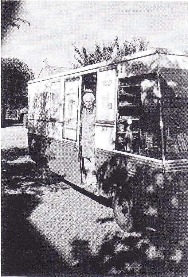
Folkert Stoker in de S.R.V.- wagen. (1990)

De echte melkboeren hadden hun tijd gehad.