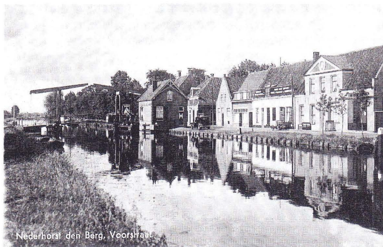
Bakkerij aan de Voorstraat "Bakkerij de Vechtstroom. Brood - koek - beschoot. Banket - chocolade - suikerwerken"

In 1953 werd de brood– en banketbakkerij en chocolaterie aan de Voorstraat 8 overgedaan aan Walther van Hal uit Oss. De familie