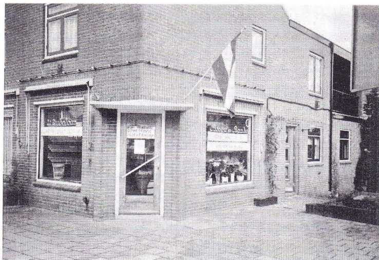
De winkel van bakker Dubelaar januari 1990, Vreelandseweg 15 hoek Kastanjelaan