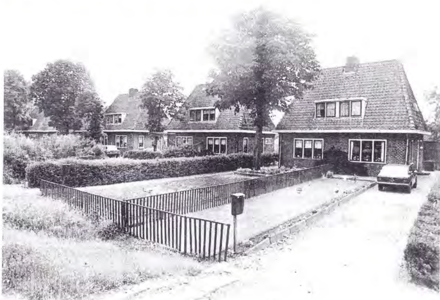
Het Rode Dorp (de "Rooie buurt"), 1980

Tot zover de belangrijkste berichtgeving over Nederhorst den Berg in de 49 e Jaargang van "De Gooi- en Eemlander". Hopelijk heeft de korte dorpsbeschrijving en de daarop volgende berichtgeving bij menig lezer de belangstelling voor Nederhorst den Berg in de navolgende jaren aangewakkerd.