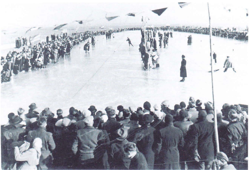
Kampioenschap van Nederland, 1950 te Westzaan. 1° plaats Nan Rotgans. 2° plaats Theo Janmaat.

Op 29 januari 1950 veroverde Theo het kampioenschap van het Gewest Noord-Holland/Utrecht over de kortebaanafstand van 160 meter in 44,6 seconden. Hij verdiende er tevens f100,- mee.