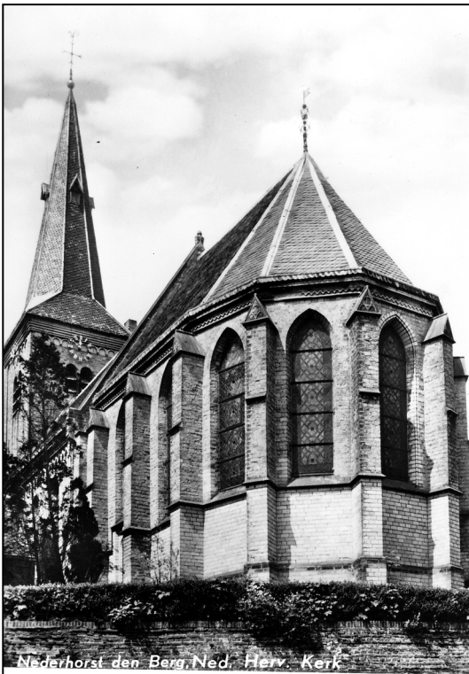
De kerk van Willibrord.

Religie en kerk speelden op veel plaatsen een grote rol in de overgeleverde volksverhalen. Talloos zijn de opgetekende verhalen over beelden en afbeeldingen, die zich niet lieten verwijderen van de plaats waar ze stonden.