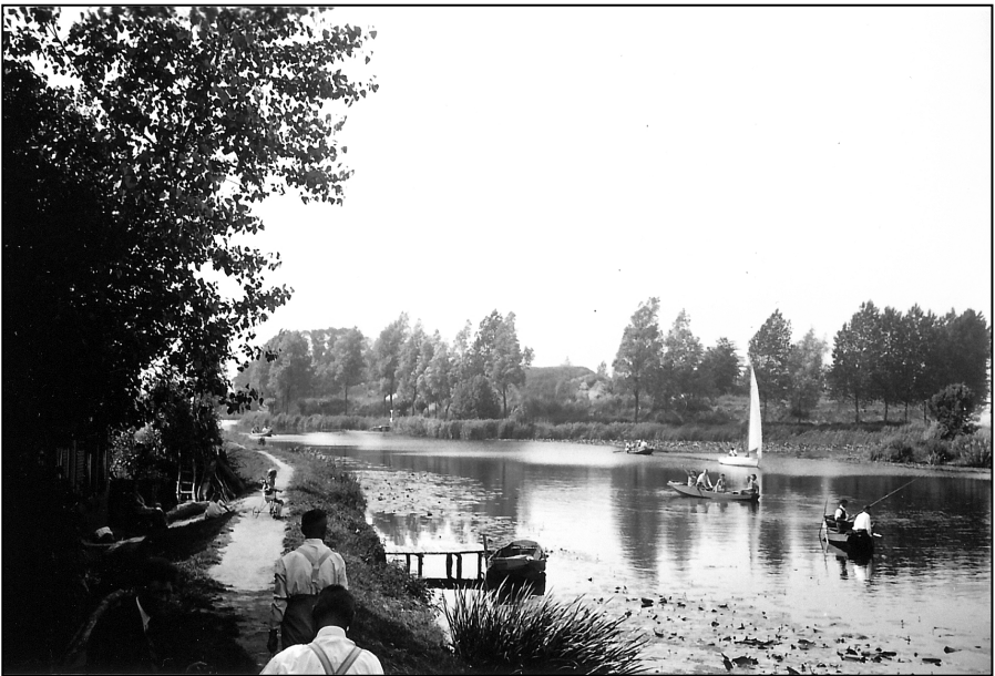
Vechtgezicht aan de Hinderdam. Het Jaagpad met op de achtergrond het fort Hinderdam.