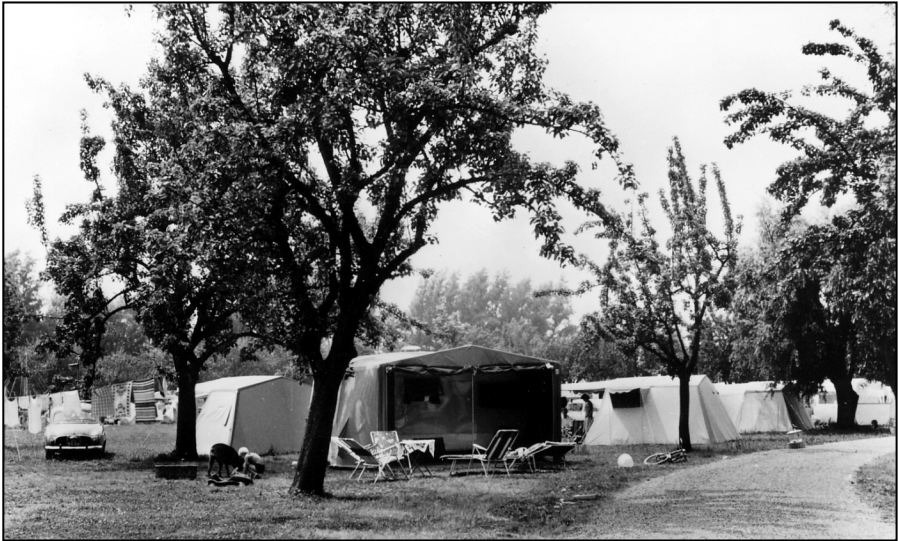
Camping Vechtoever eind zestiger jaren; de auto bij de tent en de was tussen de bomen.

Wie op een mooie zonnige dag het Kleine Eiland rondwandelt en over de dijk loopt langs de oude fruitbomen waant zich haast niet in Nederhorst den Berg. De rust, het gezang van de vogels met soms, afhankelijk van de wind, op de achtergrond het gezoem van de A 2. Het is een dorpje op zich. Het gezicht over de Vecht op de Hoekermolen, het wijidse landschap en even verderop de oude boomgaard van Wittenstein, het is een plaatje. Ongetwijfeld is het niet slecht vertoeven op de camping.