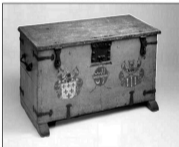
Afb. 2. Archiefkist Stalpert van der Wiele.