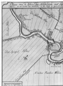
Afb. 1. Kaart uit 1726.

In een eerdere aflevering van Werinon maakten we kennis met de geschiedenis van de buitenplaats 'Overdawl' als onderdeel van de vroegere Gouden Ring rond de Hinderdam. 1