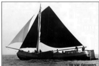
De vier gebrouwers, 1978

Reacties graag naar werinon@historischekring.nl