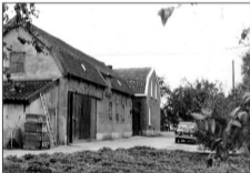
Laatste jaar Stilhorn (1965).