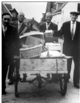
Het feestwiel van de Overmoerse Kermis op weg naar het feestterrein.

jaren lang op 31 augustus, vond altijd in het centrum plaats. Maar gedurende vele jaren werden er ook één's per jaar zomerspelen met een eigen kermis in Overmoer georganiseerd.