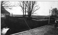
De oude tjalk