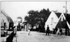
Bij het ANWB-bord ontstond 'De Beurs'.

Maar traditioneel kwamen de mannen dagelijks bijeen op wat in de volksmond 'De Beurs' werd genoemd, een punt van samenkomst onder het grote ANWB-bord op de driesprong vóór De Herberg. Ze bespraken daar van alles. Bijzondere aandacht kregen voorbijkomende dames, die bovendien allerlei opmerkingen en goede adviezen meekregen. Sommige mannen werden dan ook vaak schertsend vrouwentroosters genoemd.