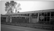
Een verlaten Riviera.

Er zijn ná de oorlog honderden nieuwe woningen gebouwd voor de eigen bevolking maar ook voor veel mensen van buitenaf. Natuurlijk moesten veel oude karakteristieke woningen, winkels en gebouwen plaatsmaken voor nieuwbouw of van bestemming veranderen. Op de plaats van het snoepwinkeltje tegenover het oude café kwam eerst een busstation en later een parkeerplaats. Ook de z.g. tocht tegenover het garagebedrijf is al jaren geleden gedempt en thans in gebruik voor parkeren en woningbouw. De in een ander jasje gestoken en sterk uitgebreide voormalige melkfabriek, die jarenlang gezichtsbepalend was en als producent van matrassen werk bood aan vele mensen, paste niet langer in de bestemmingsplannen. De Riviera schuimrubberfabriek was niet weg te denken uit Overmeer, maar moest desondanks uitwijken naar Huizen.